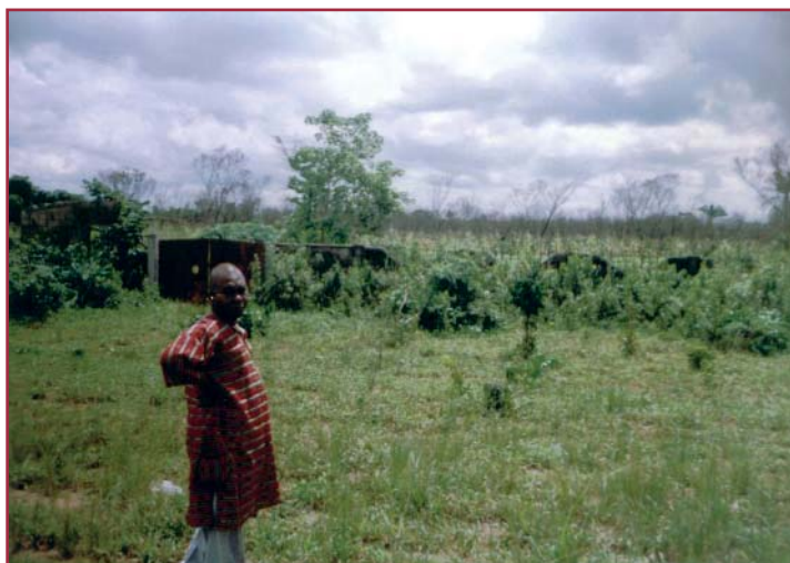
Imagen del proyecto en Owerri (Nigeria)

Con el fin de proteger los derechos básicos de la población infantil, los fundadores de Deporte y Desarrollo inician en 1998 un primer proyecto en Owerri (Nigeria). Este pequeño poblado al sureste del país, con algo más de 165.000 habitantes y una extensión tropical de 65 km 2 , fue el lugar escogido para poner en marcha las bases constitutivas de la asociación: el deporte como una forma de crear nexos de unión entre los pueblos, y un aliciente para estimular a la juventud durante el proceso educativo.